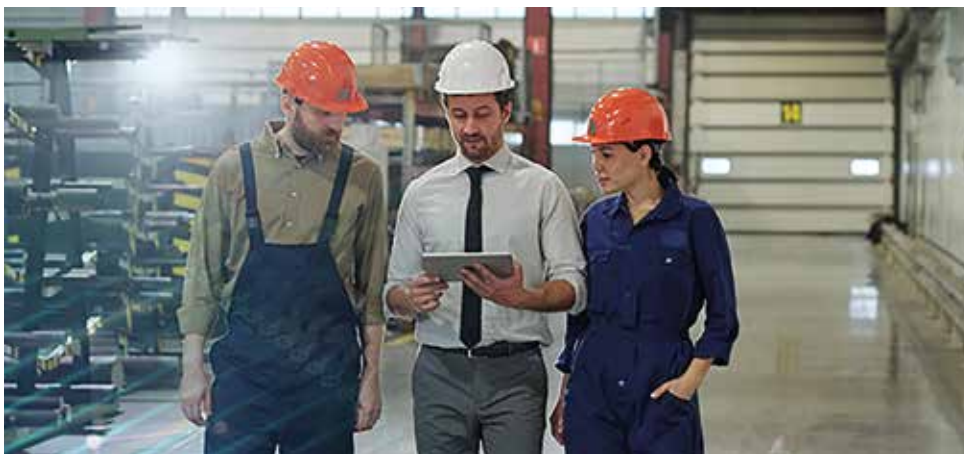
L'Accademia Auvesy-MDT assiste i dipendenti nell'apprendimento dell'uso di octoplant, fornendo un feedback personale e un supporto continuo

L'assistenza ai dipendenti è un altro dei vantaggi principali dell'implementazione di octoplant. L'Accademia Auvesy-MDT assiste i dipendenti nell'apprendimento dell'uso di octoplant, fornendo un feedback personale e un supporto continuo. In questo modo si garantisce che tutti gli utenti comprendano come utilizzare al meglio le funzionalità della soluzione. Proprio come octoplant è un punto centralizzato per tutta la documentazione dell'impianto e del processo, l'accesso alla nostra accademia centrale rende più facile che mai la formazione dei nuovi dipendenti e il mantenimento delle loro competenze nella vostra forza lavoro.